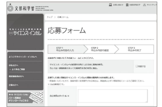
(第6回サイエンス・インカレ応募フォーム)